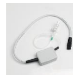
POD Universale POD Multipaziente Manometria a 1 canale